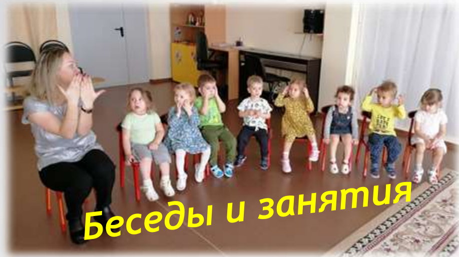
Беседы и занятия