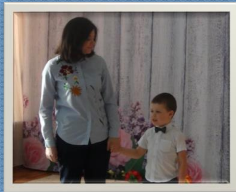
Совместные с детьми и родителями театрализации