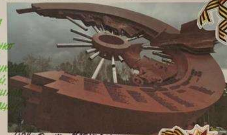
Цибуло ич. Мухомовского