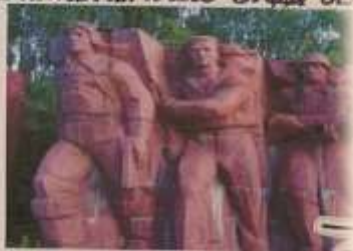
в. Субботников 1