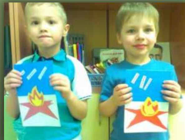
Открытки ветеранам ВОВ