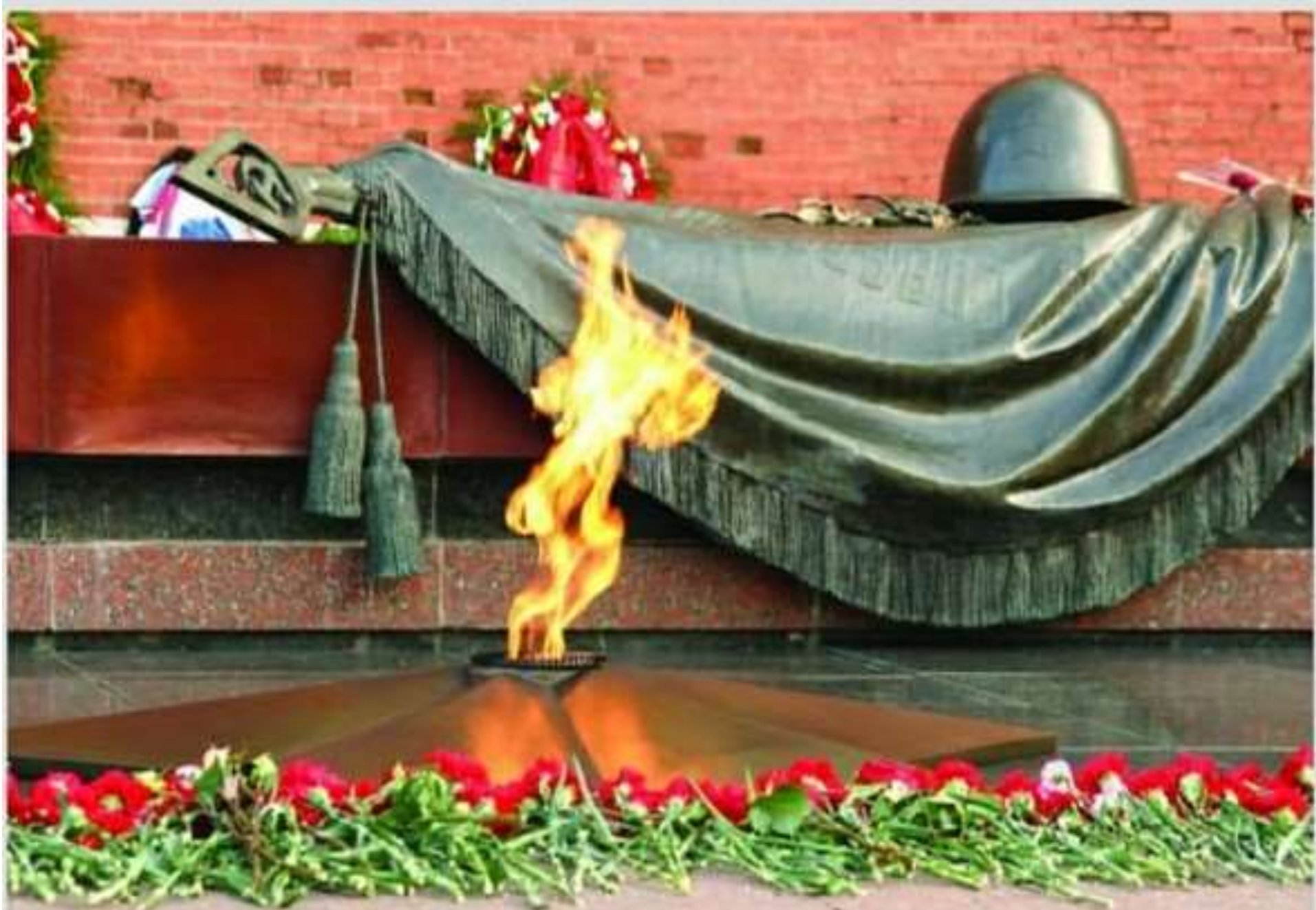
«Вечный огонь» у кремлевской стены.